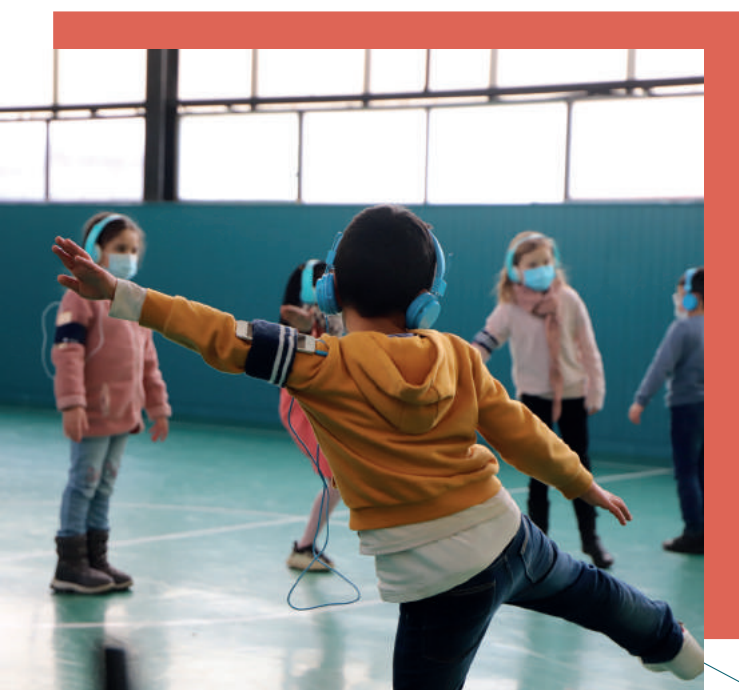
© Delphine Bressot - Le Dancing CDCN